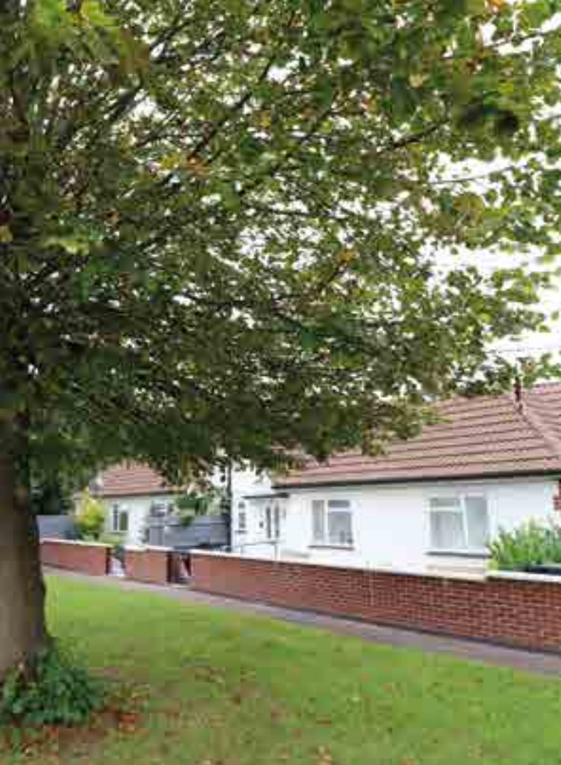
Rockfield Avenue, Trefynwy Llys Mounton, Drenewydd Gelli-farch