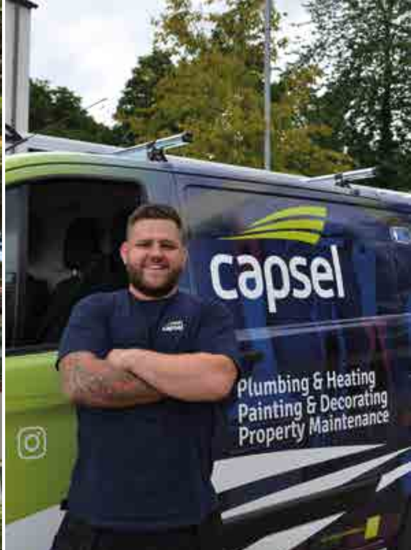
Un o staff Capsel (ein his-gwmni)