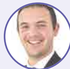
Mat Cooling Aelod Annibynnol, Pwyllgor Archwilio