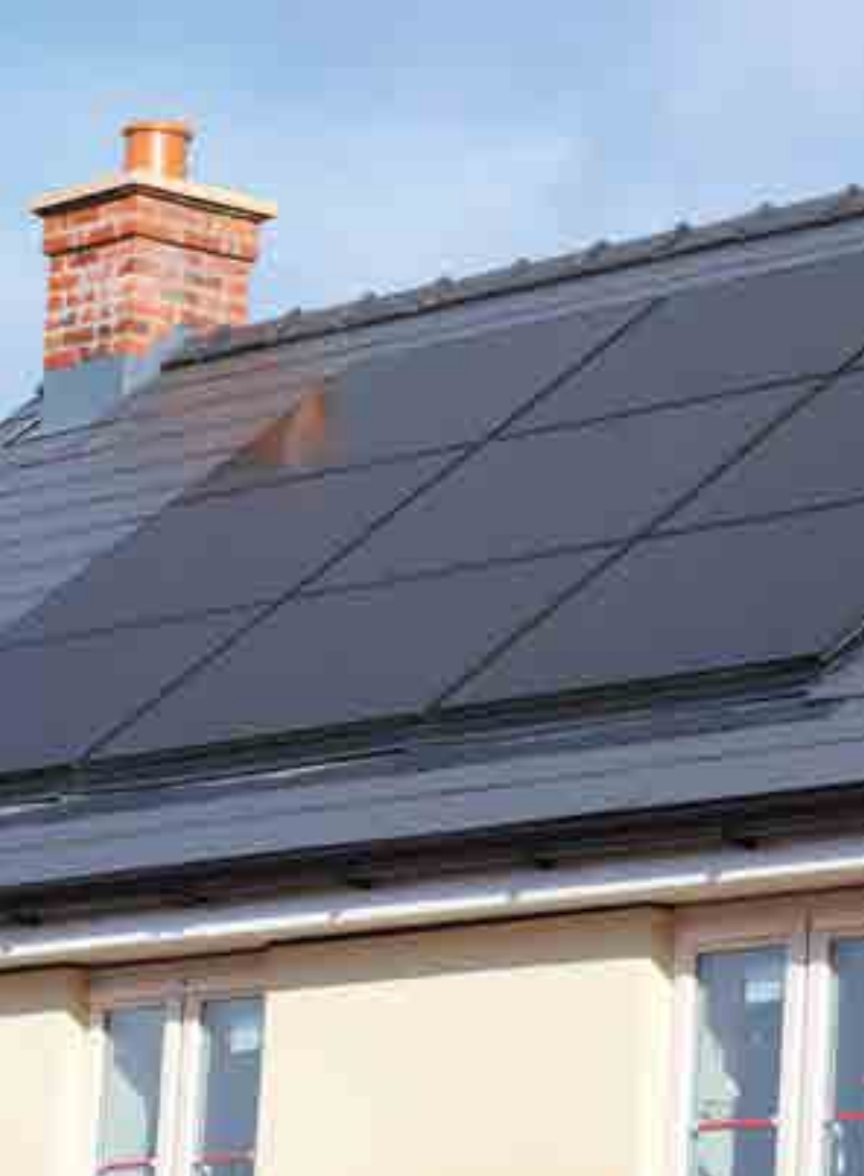
Panelli Solar yn y Dyfawden, Y Fenni