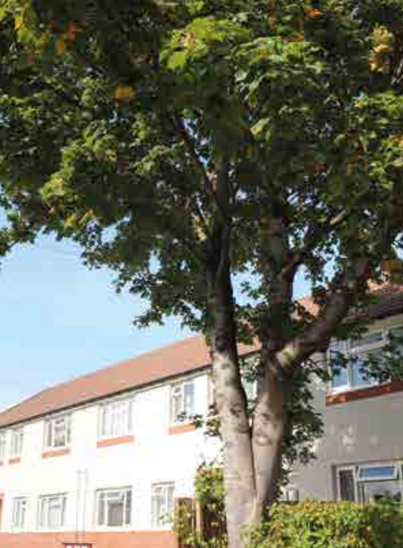
Fflatiau yn St David's Road, Y Fenni