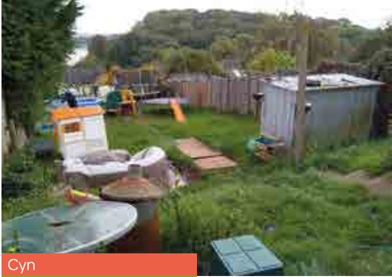
Cyn Ar ôl