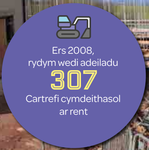
Datblygiad tai yn Y Dyfawden, Y Fenni Prynhawn o hwyl yng Nghil-y-coed