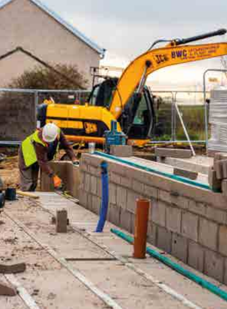
Gwaith adeiladu Pembroke Road, Chepstow Byngalos Oak Grove, Trefynwy