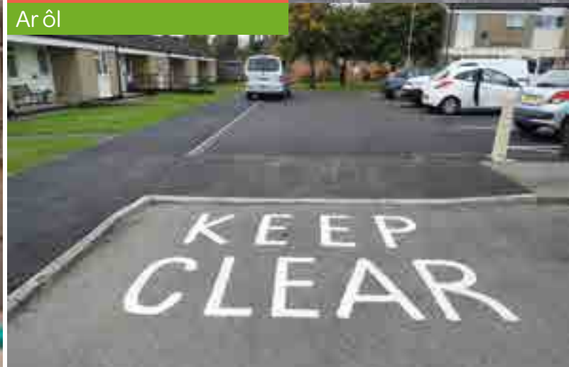
Gwelliannau yn St Mary's Place, Porthsgiwed