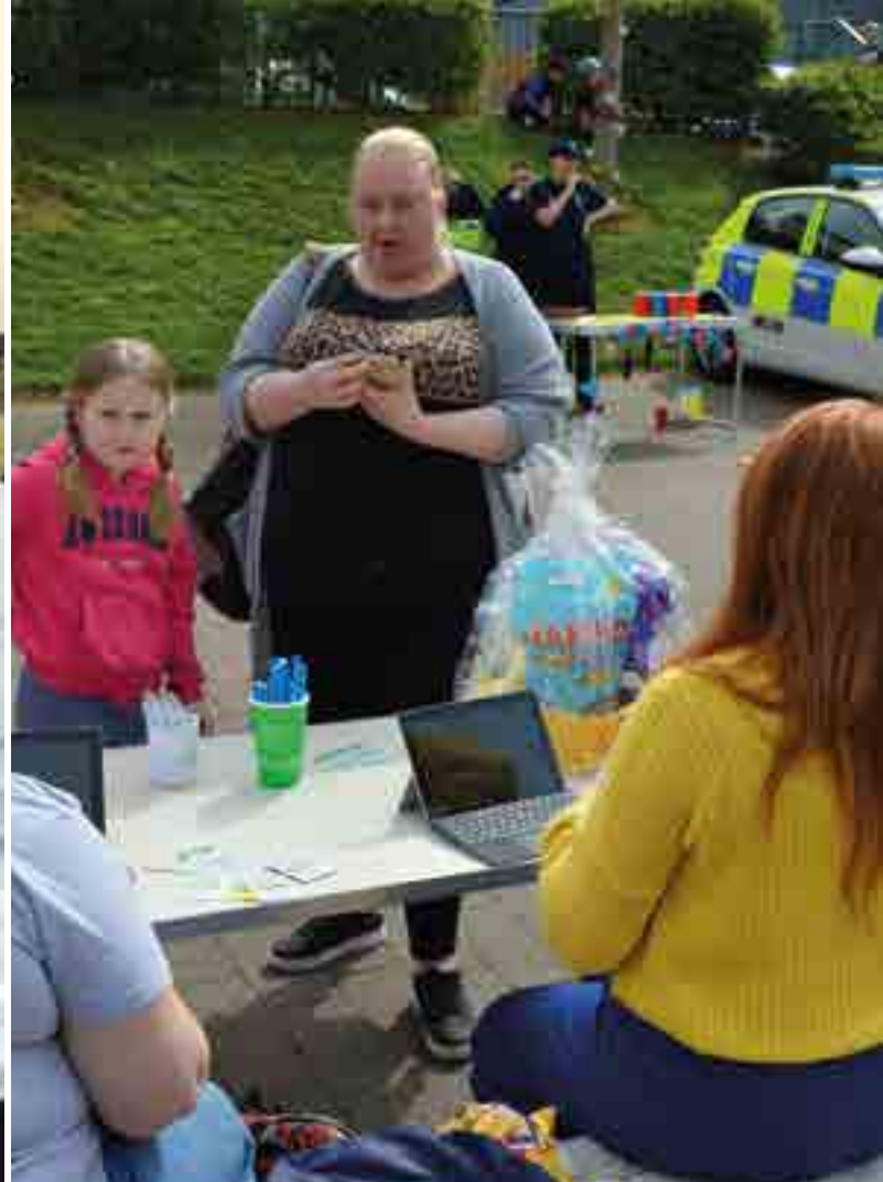
Cynnig cyngor yn y gymuned