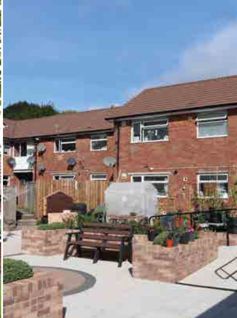
Gerddi Davies Court, Y Fenni