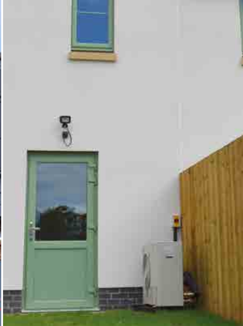
Pwmp gwres daear yn Llandeilo Gresynni