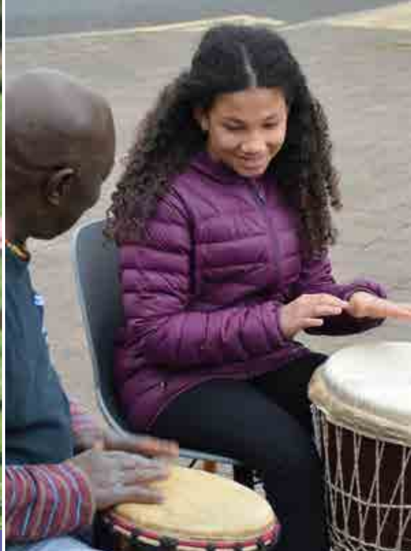
Sesiwn drymio yn TogetherWorks, Cil-y-coed