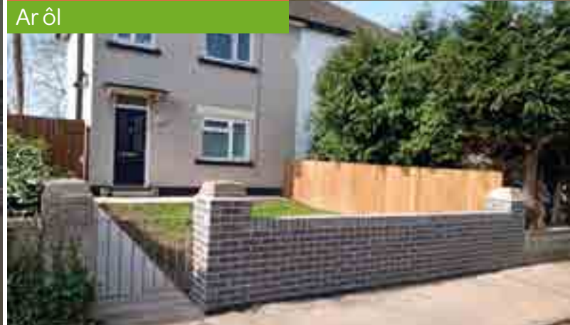
Gwelliannau yn St Tecla Road, Bulwark