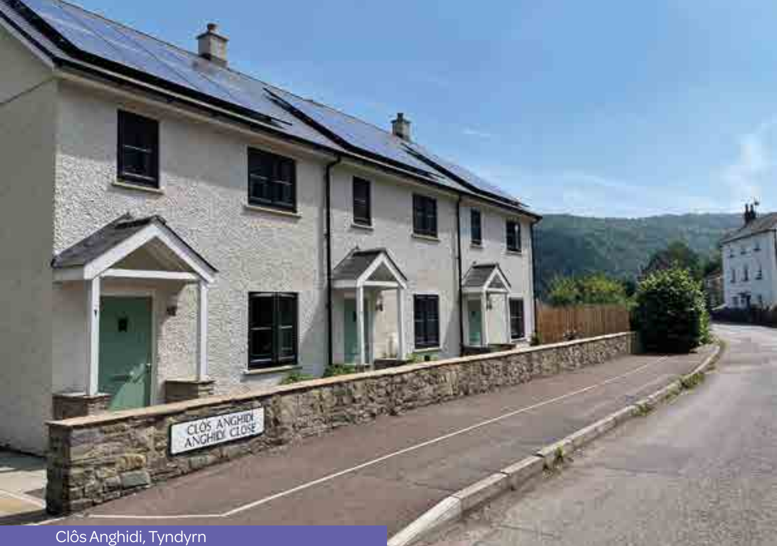
Clôs Anghidi, Tyndyrn