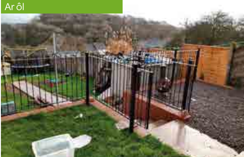
Gwaith mewn gerddi yn Raglan Way, Cas-gwent