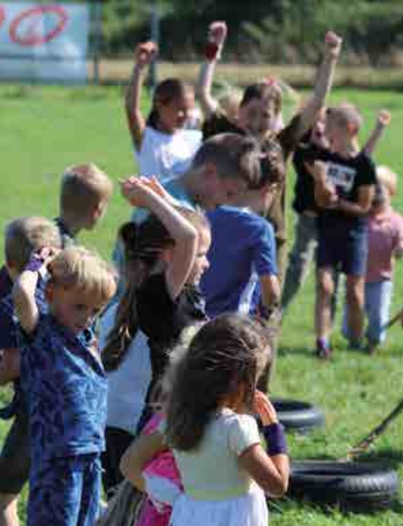
Hwyl yng Nghlwb Rygbi Cil-y-coed Sesiwn drymio yn TogetherWorks, Cil-y-coed