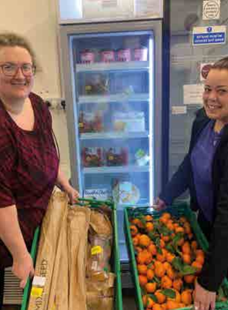
Cwtch Angels, Y Fenni