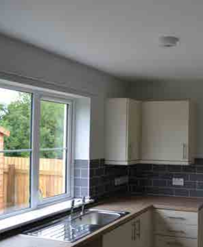
Gwaith o ansawdd yn Llandeilo Gresynni