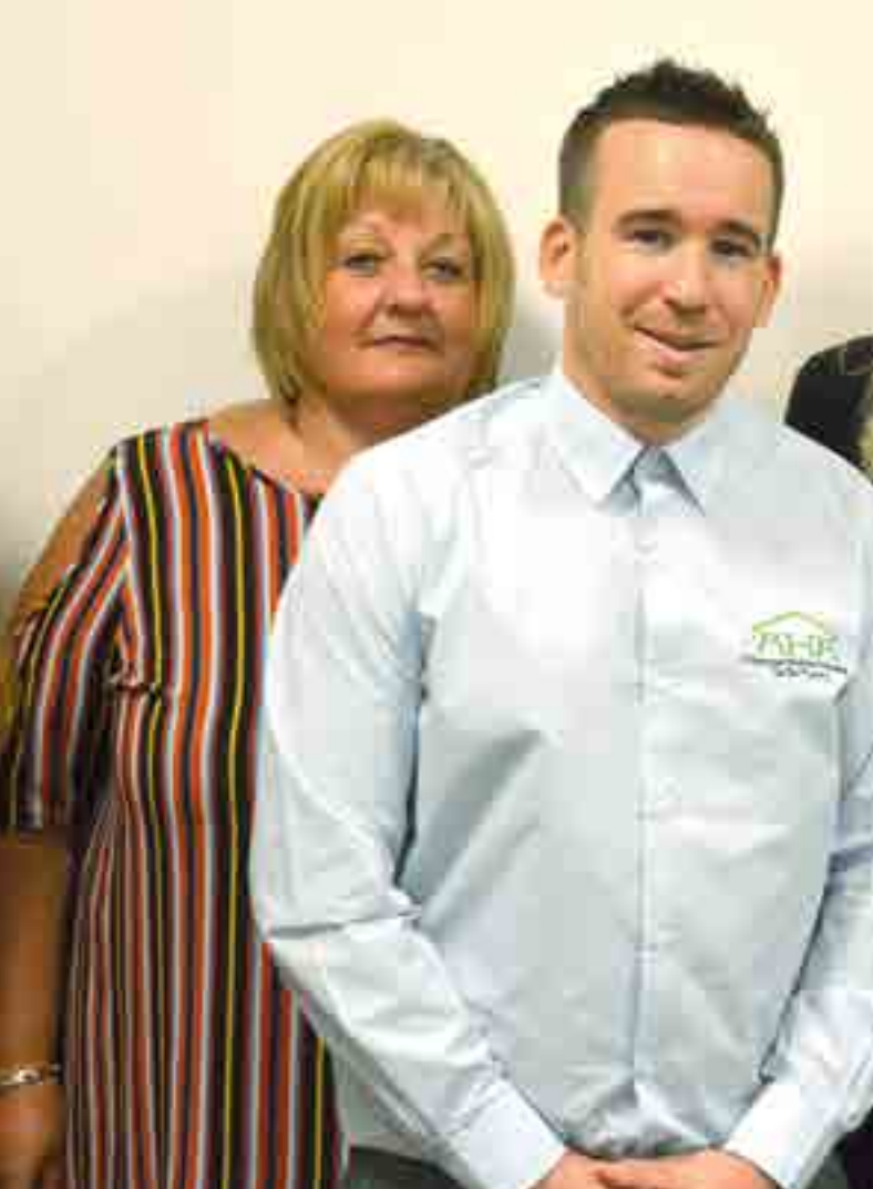
Rhai o'n Tîm Cynhwysiant