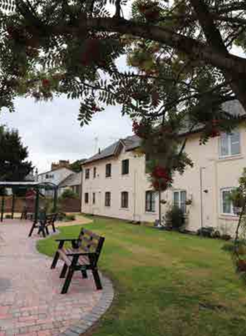
Fflatiau yn St David's Road, Y Fenni Ar y safle yn y Fenni