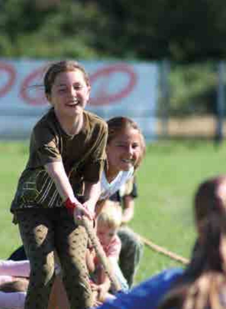
Hwyl i'r teulu yng Nghlwb Rygbi Cil-y-coed Cefnogi'r Gymuned