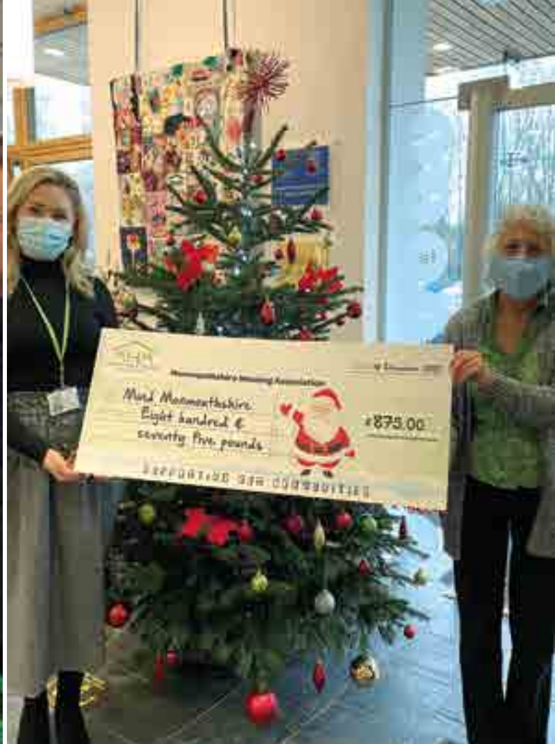
Rhodd i Mind Sir Fynwy