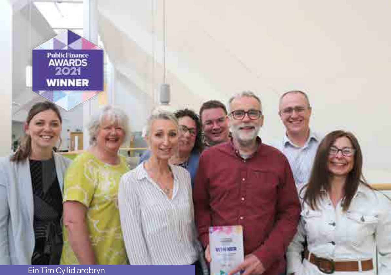
Ein Tîm Cyllid arobryn